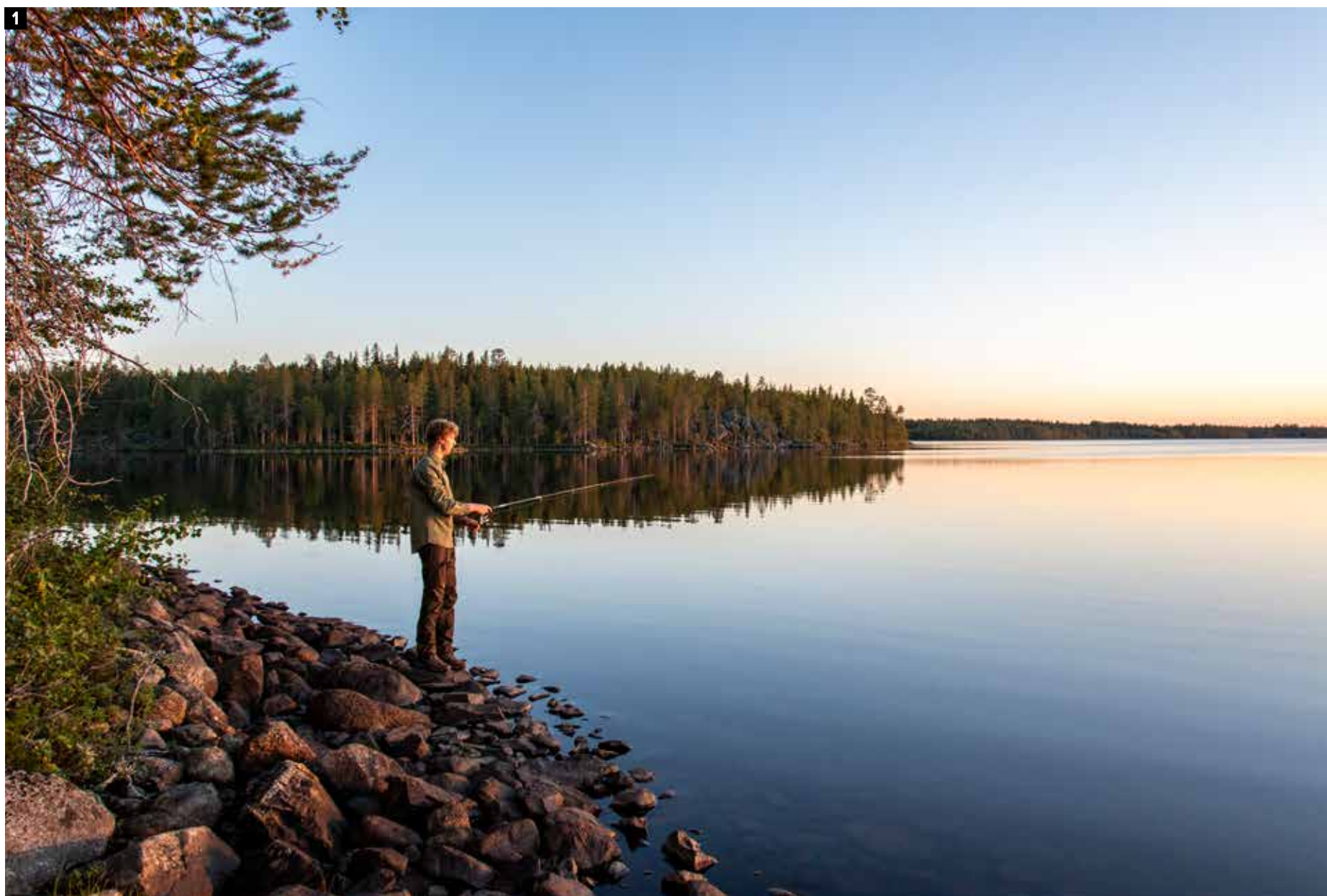
1 Een lekker visje vangen voor op de barbecue. 2 Plukken en meteen smullen, Tibe zorgt voor het dessert. 3 Het avondlicht zet de Mårdseleforsen in vuur en vlam.

Onze technologieverslaafde kinderen missen ze geen minuut. Twijgjes zoeken om vuur te maken, deeg kneden voor een brood of een pijl maken met je zakmes is zoveel leuker. Op het kampvuur grillen we onze vers gevangen vis en we zitten gezellig bij elkaar. Boven het vuur hangt onze Dutch oven waarin het brood begint te geuren, en de stilte wordt alleen verbroken door enkele trompetterende kraanvogels. De zon zakt en zorgt voor een schouwspel van betoverende kleuren boven het meer, donker wordt het echter niet. En moe? Dat worden we ook niet. Verbazingwekkend wat het doet met je lichaam om vierentwintig uur per dag zonlicht te krijgen.