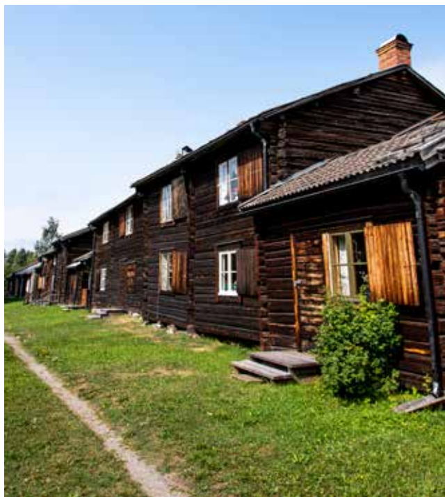
De sfeer van lang vervlogen tijden in het kerkdorp Bonnstan.

toegangswegen zijn versperd en we zien her en der gigantische rookpluimen. Tientallen grote en kleinere brandhaarden teisteren het land, de aanhoudende droogte eist haar tol. Het is niet veilig om noordelijker te reizen. Bij Skellefteå ontdekken we een kleinere kerkstad, bekend als Bonnstan. In de 16de eeuw zorgde de protestantse reformatie voor strikte regels over het kerkbezoek, alle parochieleden moesten op zon- en feestdagen naar de kerk. In de praktijk bleek dit in het noorden erg moeilijk, de parochies waren reusachtig. Omdat het niet mogelijk was op één dag over en weer te rijden, werden er kerkdorpen ingericht. Het werden ontmoetingsplaatsen waar nieuwtjes werden uitgewisseld, belastingen geïnd en recht werd gesproken. Bonnstan is de authentiekste van de ooit 47 kerkdorpen in Norrbotten en Västerbotten, want renovatie of modernisering van de huisjes - die nu gebruikt worden als zomerhuisjes - is verboden. We struinen tussen de scheve, houten huisjes met hun kleurige luiken en snuiven de sfeer van lang vervlogen tijden op, toen slow living doodgewoon de manier van leven was. ■